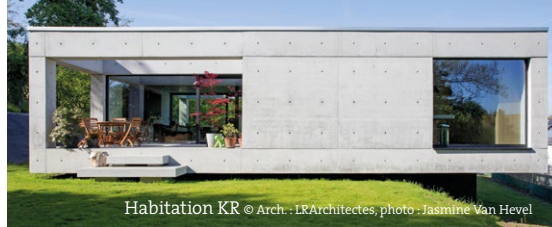
Habitation KR © Arch.: LRArchitectes