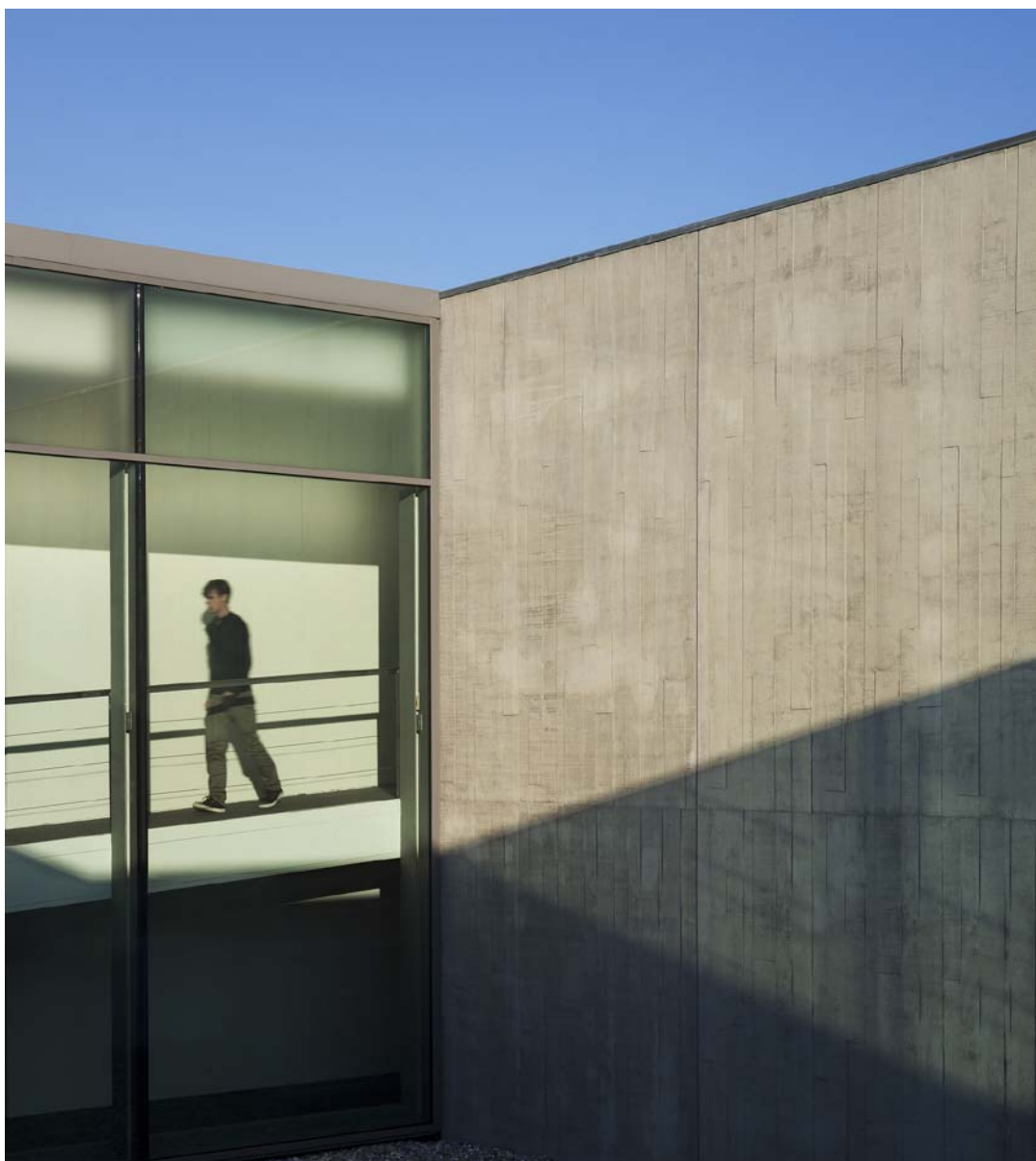
Gestructureerd door een reliëf van houten planken, zichtbare betonoppervlakken die zich met finesse bevestigen.